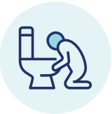
Buồn nôn và ói mửa