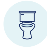
Phân có màu nhạt hoặc nước tiểu sậm màu