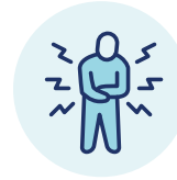
Đau vùng bao tử